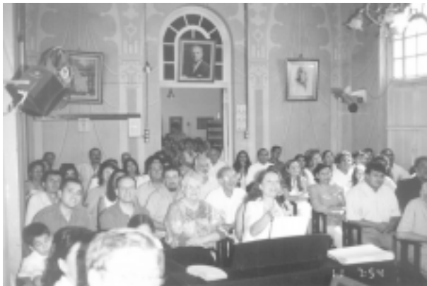
Otras vistas de la concurrencia durante la proyección de fotos de la Fraternidad.