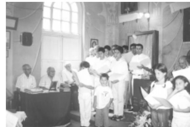
Vistas del Templo durante la actuación del coro de la Fraternidad.