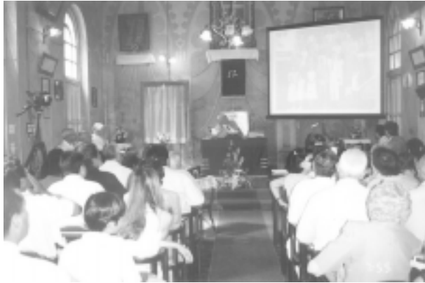
Instantáneas del Templo durante la proyección de fotos recordatorias en el Servicio Dominical de la Fraternidad.