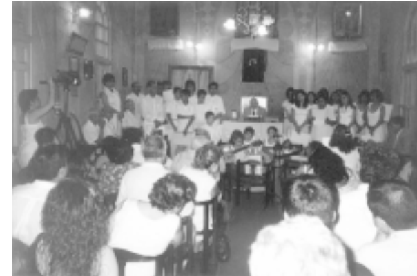
Imágenes de la actuación del coro de la Fraternidad con motivo del aniversario 77.